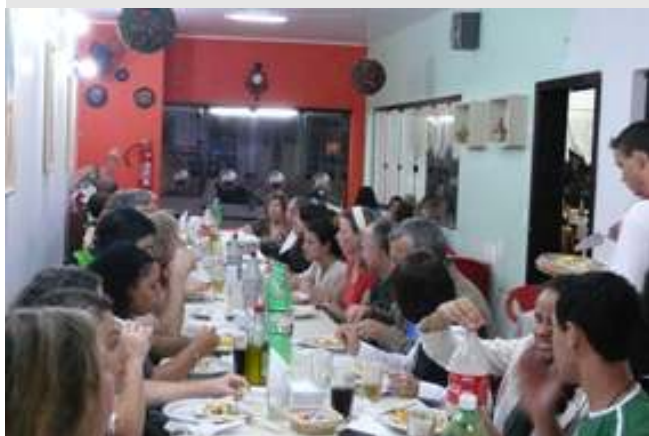
Jantar em comemoração ao Dia do Servidor com os servidores da UFPR Litoral em Matinhos.

Representante do Ministério do Planejamento e Coordenadora da FASUBRA participam de Debate sobre Fundações Estatais de Direito Privado no HC, dia 02 de dezembro.