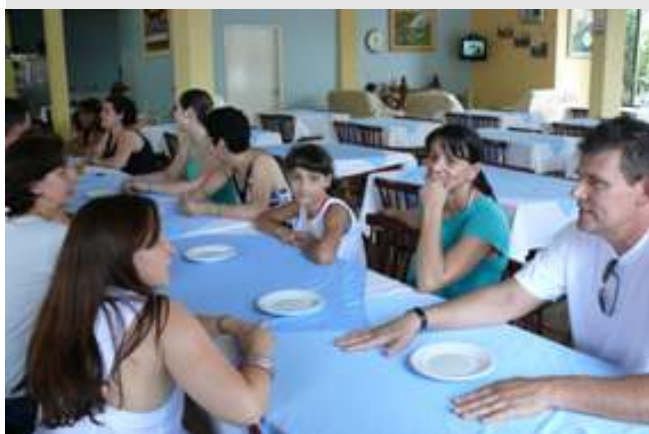
Almoço em comemoração ao Dia do Servidor no Campus de Palotina.