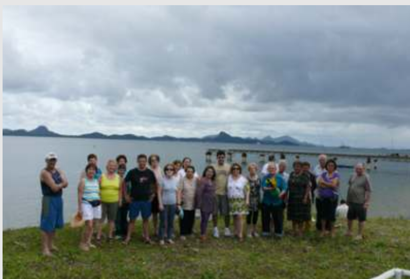
Passeio dos Aposentados na Colônia de Férias do SINDITEST-PR em Itapoá, dia 08 de novembro.