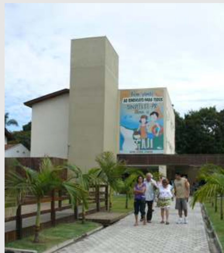
Curso de Relações no Trabalho, Saúde e Assédio Moral realizado de 10 a 14 de novembro. Essa é mais uma ação do GT Saúde do Trabalhador com enfoque no combate ao Assédio Moral, do SINDITEST-PR.