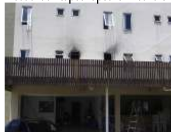
Sede de Itapoá após o incêndio.

Ainda há vagas disponíveis para a temporada, basta entrar em contato com a secretaria do sindicato.