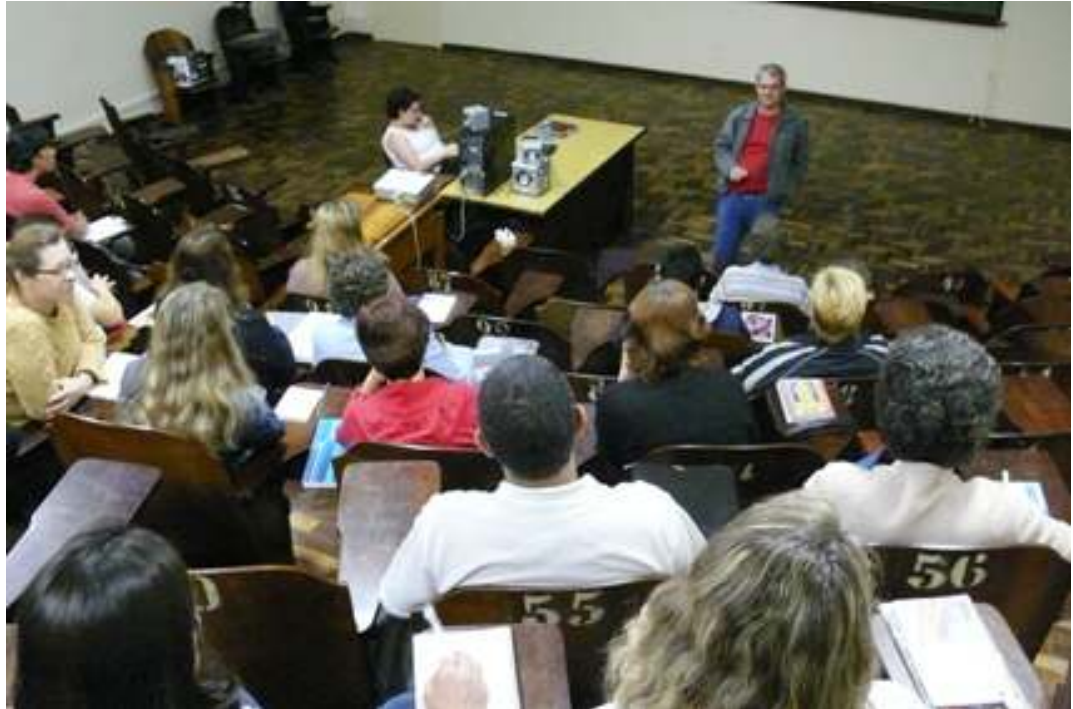
Uma palavra com sindicato no primeiro dia de aula.

Nossa gestão quer atuar em parceria com a CIS para fiscalizar a aplicação dos recursos destinados à capacitação dos servidores. Esperamos que a capacitação também seja um esforço da próxima gestão da PROGEPE.