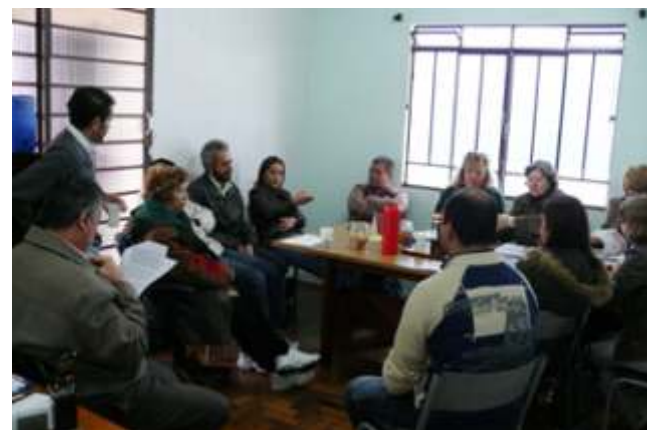
Reunião do GT de Saúde do Trabalhador

Esse texto é produto do Grupo de Trabalho em Saúde do Trabalhador do SINDITEST-PR.