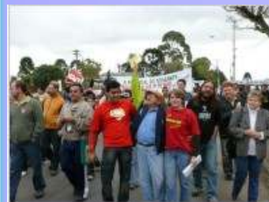
Ato do Dia Mundial dos Trabalhadores em Curitiba