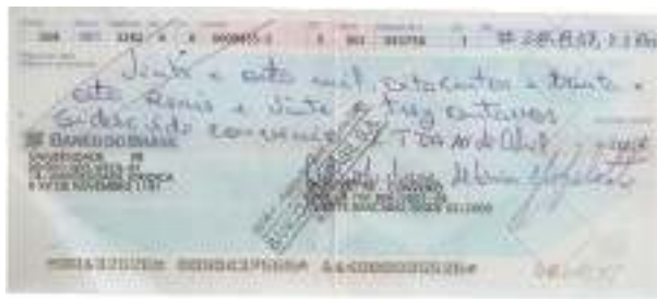
Cópia do cheque sem-fundos emitido pela gestão anterior, devolvido pelo Banco referente à parte do pagamento Pleno Card.

Queremos dizer ainda, sobre a referida prestação de contas, que o Conselho Fiscal eleito