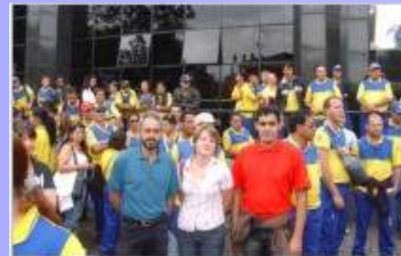
Greve dos Correios

Assim, quando precisarmos, essas categorias estarão conosco em nossa luta.