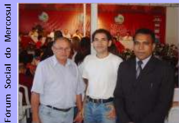
Fórum Social do Mercosul