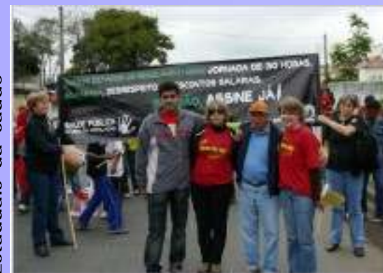
Ato dos Servidores Estaduais da saúde