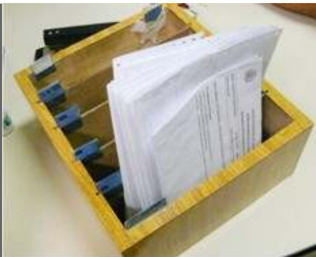
Fichas se acumulam toda manhã, pacientes chegam às 7 horas e só podem ser atendidos às 16 horas