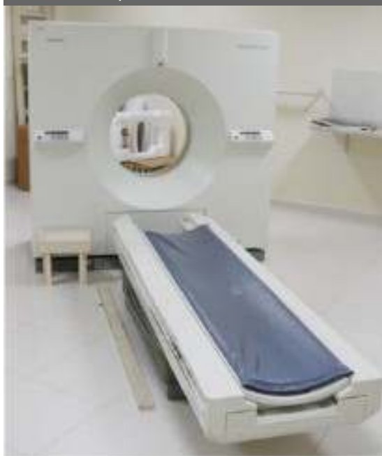
Aparelho de tomografia estragado há três anos