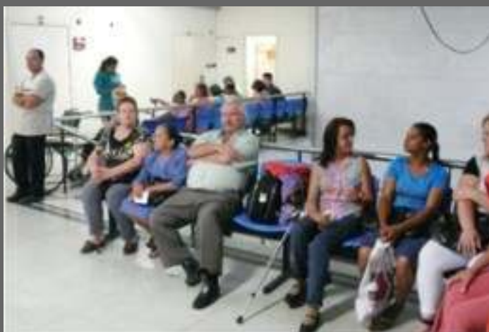
Fila de pacientes á espera do raio-X