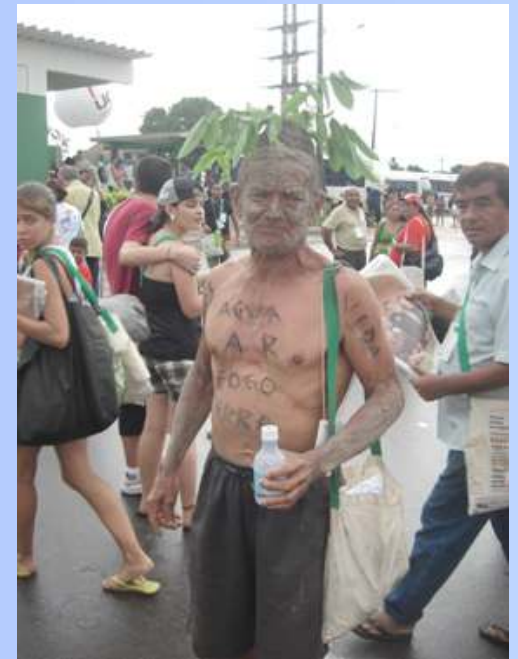
Manifestante no FSM/2009:

...Neste sentido temos que lutar, apelando a uma movimentação popular o mais ampla possível, por uma série de medidas urgentes, como a nacionalização dos