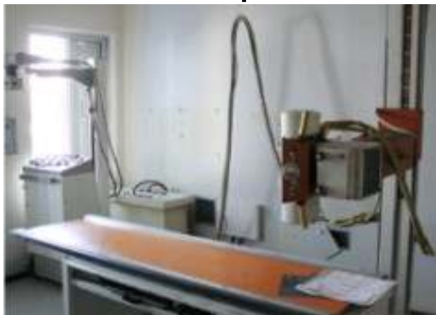
Dos quatro equipamentos de raio-x do HC, dois estão quebrados!