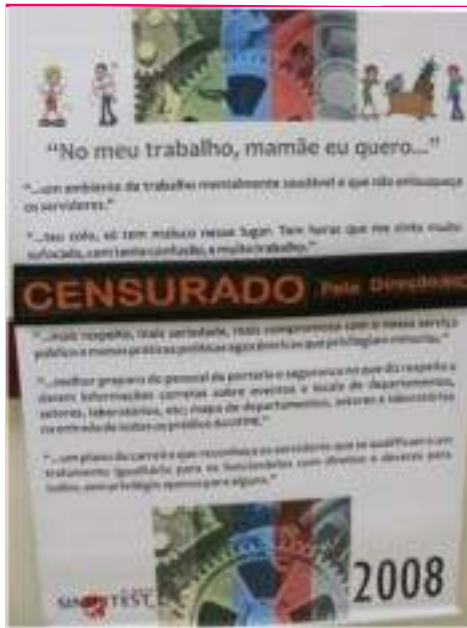
Banner censurado pela Direção Geral do HC

Durante a exposição da Campanha “No meu trabalho, mamãe eu quero...” no Hospital de Clínicas, um dos banners foi recolhido pela Direção Geral com a alegação de que era ofensivo e usava termos pejorativos, como por exemplo a palavra “caterva”. Pelo dicionário, existem três significados possíveis para este termo, qual deles você acha que a Direção entendeu que era ofensivo?