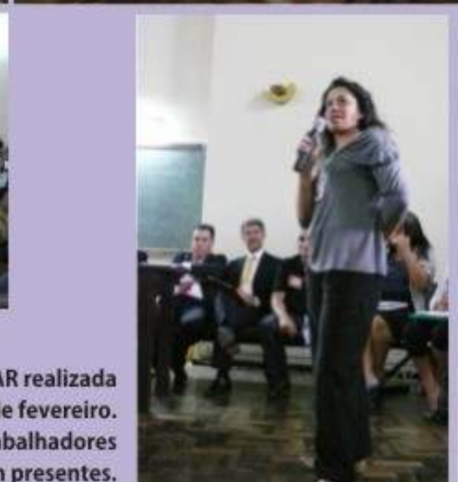
Fotos da assembleia FUNPAR realizada no dia 25 de fevereiro. Em torno de 600 trabalhadores estiveram presentes.