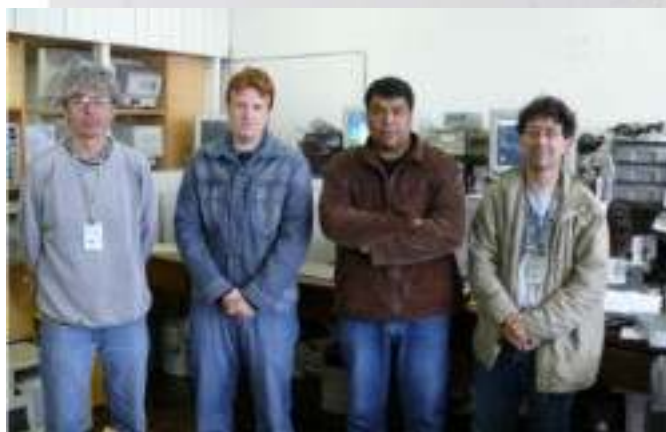
Alguns dos funcionários do CCE que receberam aviso prévio

A licitação da terceirização do CCE (3ª tentativa) deixa dúvidas como: