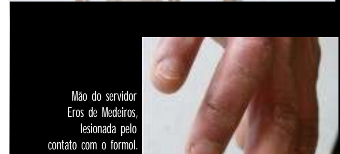
Mão do servidor Eros de Medeiros, lesionada pelo contato com o formol.