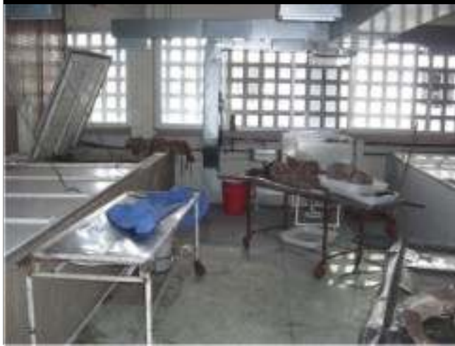
Antes da reforma, que terminou em março, as condições eram ainda piores