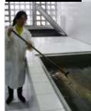
Servidora tem que remover corpo humano do tanque de formol com auxílio de "pedaço de pau"

O SINDITEST não vai mais tolerar a negligência desta instituição em relação à vida desses trabalhadores. Ministério do Trabalho e outros órgãos competentes serão acionados já!!!