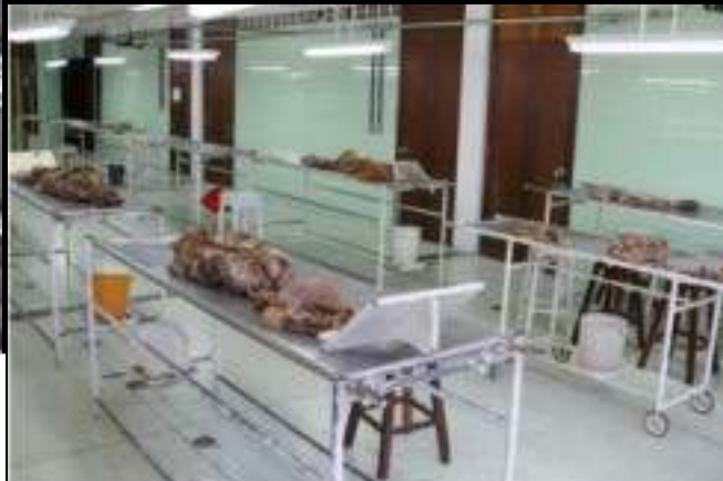
Após as aulas, os servidores precisam recolher mais de 200Kg de materiais utilizados em sala