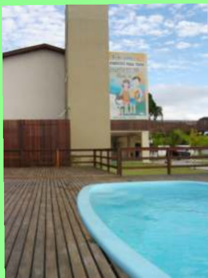
Nossa sede fica a aproximadamente 200 metros do mar.

A gestão “Sindicato Para Todos” deseja a todos e todas uma ótima estadia em nossa sede em Itapoá, pois todos precisamos recarregar as energias para os momentos de luta do próximo período.